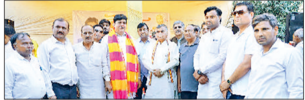
सोनीपत। कार्यक्रम के दौरान सांसद, जिलाध्यक्ष, पूर्व विधायक एवं अन्य नेता।