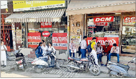
सोनीपत। गीता भवन चौक पर बनाए गए परीक्षा केंद्र के बाहर प्रवेश मिलने का इंतजार करते विद्यार्थी।

समय से पहले केंद्रों के बाहर जुटे विद्यार्थी, अभिभावकों की लगी मीड हरिभूमि न्यूज़ सोनीपत