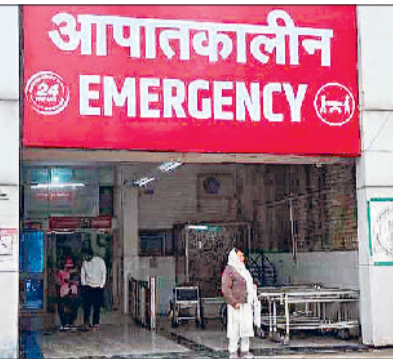
सोनीपत। इलाज के बाद बाहर आते लोग।