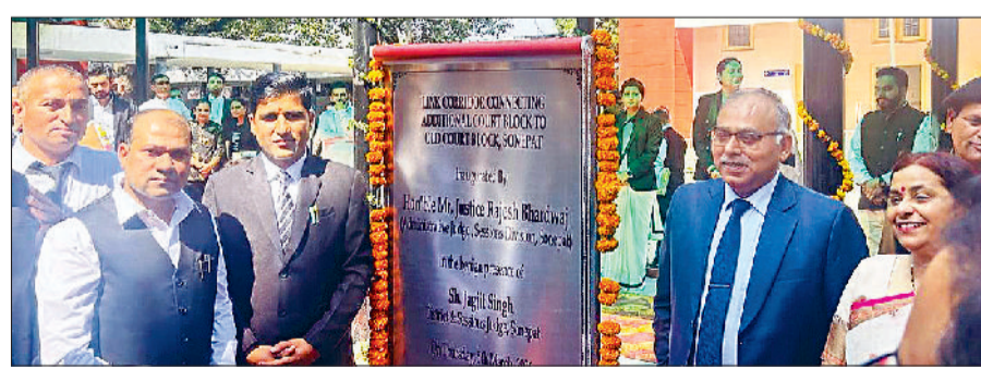
सोनीपत। जिला न्यायालय परिसर में बार व बेंच के बीच बनाए गए नए कॉरिडोर का उद्घाटन करते हाईकोर्ट के जस्टिस राजेश भारद्वाज, मौजूद अन्य।